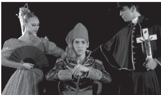
El Ballet Internacional de la Costa presenta la obra "Camilo"